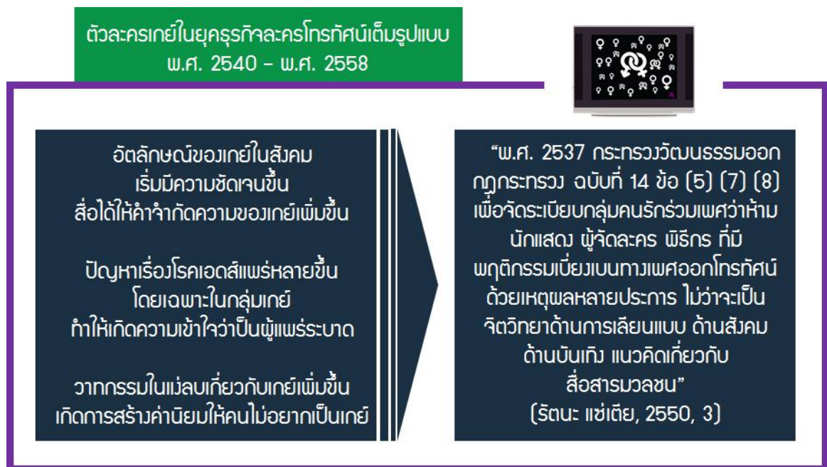
ภาพที่ 2 ตัวละครเกย์ในยุคธุรกิจละครโทรทัศน์เต็มรูปแบบ

ดังภาพที่ 2 ละครโทรทัศน์การนำเสนอภาพลักษณ์ของเกย์ไม่ได้รับความนิยม เนื่องจาก “พ.ศ. 2537 กระทรวงวัฒนธรรมออกกฎกระทรวง ฉบับที่ 14 ข้อ (5) (7) (8) เพื่อจัดระเบียบกลุ่มคนรักร่วมเพศว่า ห้ามนักแสดง ผู้จัดละคร พิธีกร ที่มีพฤติกรรมเบี่ยงเบนทางเพศออกโทรทัศน์ ด้วยเหตุผลหลายประการ ไม่ว่าจะเป็นจิตวิทยาด้านการเลียนแบบ ด้านสังคม ด้านบันเทิง แนวคิดเกี่ยวกับสื่อสารมวลชน” (รัตนะ แซ่เตีย, 2550, 3)