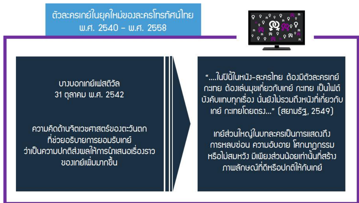
ภาพที่ 4 ตัวละครเกย์ในยุคใหม่ของละครโทรทัศน์ไทย

การยอมรับเกย์ที่เปลี่ยนไปส่งผลถึงความนิยมของตัวละครเกย์ในยุคนี้ดังภาพที่ 3 โดยในช่วงปีพ.ศ. 2554 - พ.ศ. 2558 มีละครจำนวนมากที่มีตัวละครเกย์เป็นส่วนประกอบของเนื้อเรื่องเช่น มงกุดดอกส้ม (2554), กี่เพ้า (2555), ละครชุด Hormones วัยว้าวุ่นฤดูกาลที่ 1 - 2 (ฤดูกาลที่ 1 พ.ศ. 2556, ฤดูกาลที่ 2 พ.ศ. 2557), ซิงรักหักสวาท (พ.ศ. 2557), มาลีเรingersบำ (พ.ศ. 2557), ละครชุด Hormones 3 The Final Season (2558), นางชฎา (พ.ศ. 2558) ทั้งนี้เนื้อหาที่กล่าวถึงเกย์ส่วนใหญ่ในบทละครเหล่านี้ จะเป็นการแสดงถึงการหลบซ่อน ความอับอาย โศกนาฏกรรม หรือไม่สมหวัง มีเพียงส่วนน้อยเท่านั้นที่สร้างภาพลักษณ์ที่ดีหรือปกติให้กับเกย์ ละครโทรทัศน์ที่นำเสนอเรื่องราวของเกย์ในมุมมองที่แตกต่างจากเรื่องอื่นคือละครชุดเลิฟซิคเดอะซีรีส์ รักวุ่น วัยรุ่นแสบ (ฤดูกาลที่ 1 พ.ศ. 2557, ฤดูกาลที่ 2 พ.ศ. 2558) ที่ใช้ทประพันธ์ออนไลน์ที่มีตัวละครหลักเป็นผู้ชาย 2 คนมีความรู้สึกในเชิงคู่รักกัน