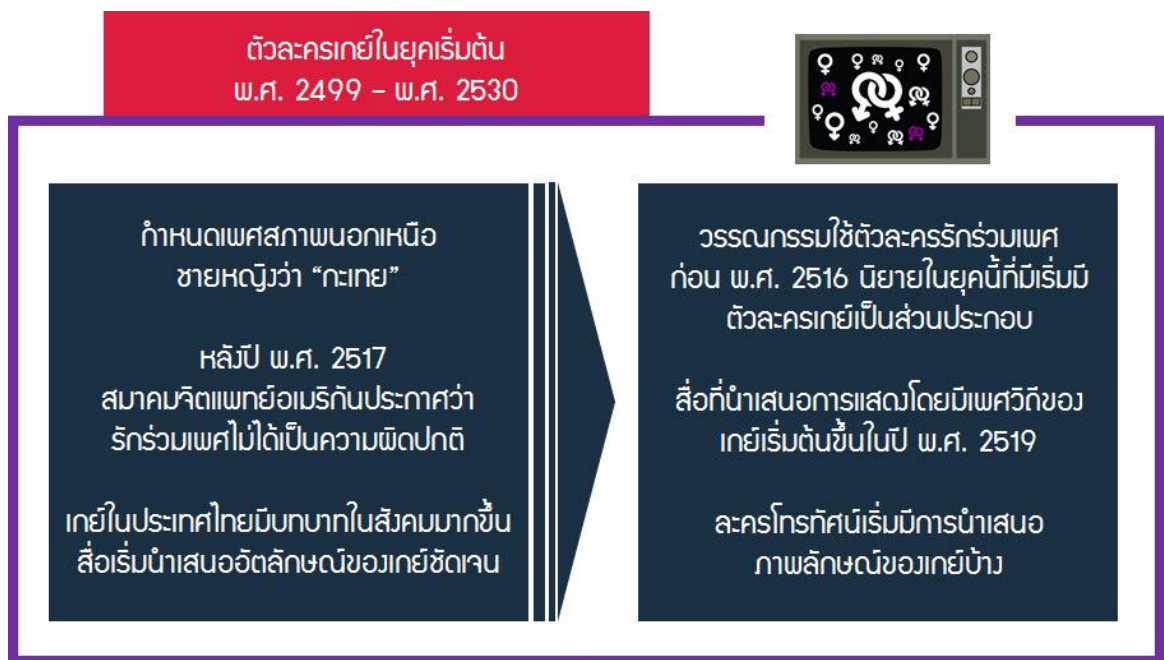
ภาพที่ 1 ตัวละครเกย์ในยุคเริ่มต้น

การยอมรับเกย์ในยุคนี้ส่งผลให้เกิดจุดเริ่มต้นของการเกิดตัวละครเกย์ขึ้นดังภาพที่ 1 ซึ่งนอกจากสื่อสิ่งพิมพ์แล้ว สื่อที่นำเสนอการแสดงโดยมีเพศวิถีของเกย์เริ่มต้นขึ้นในปี พ.ศ. 2519 จากสื่อภาพยนตร์ที่นำเสนอเรื่องราวของเกย์ในชื่อเรื่อง “เกมส์” แต่ลักษณะเนื้อหาแนะนำสภาพลักษณะของเกย์ในเชิงลบส่งผลให้สังคมไทยมองเกย์ในเชิงลบ หลังจากนั้นจึงเกิดความพยายามในการนำเสนอรูปแบบของอัตลักษณ์เกย์ในรูปแบบต่างๆผ่านภาพยนตร์ในด้านละครโทรทัศน์เริ่มมีการนำเสนอภาพลักษณ์ของเกย์บ้าง เช่น น้ำตาลไหม้ (พ.ศ. 2526) และปัญญาชนก้นครัว (พ.ศ. 2529)